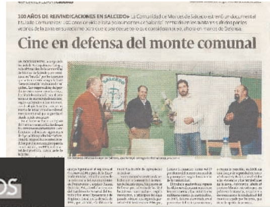
O estreo do documental recollido no Diario de Pontevedra

O documental xa se atopa á venda na nosa páxina web: antropoloxiagalega.org